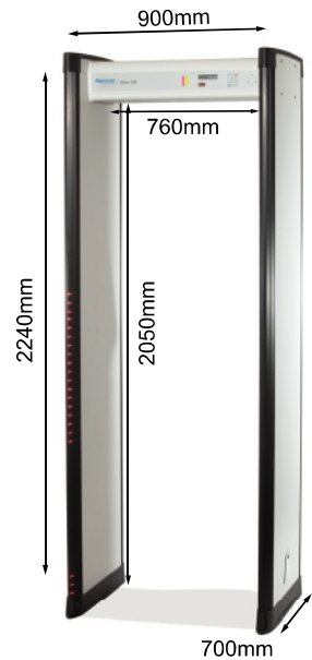
Meteor 6M金属探测门整体尺寸图